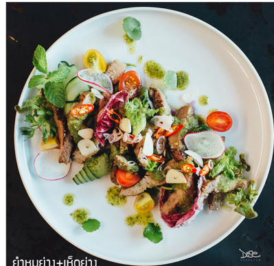
ยำหมูย่าง+เห็ดย่าง