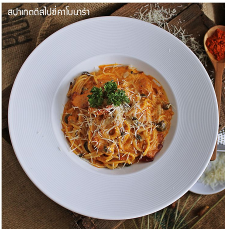
สปาเกตตีสไปซี่คาร์บอนารา