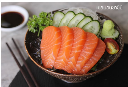
แซลมอนซาซิมิ