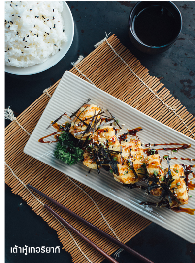
เต้าหู้เกอริยากิ