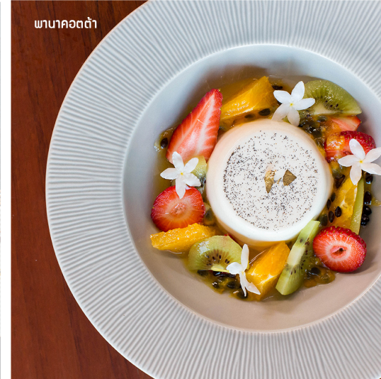
พานาคอตต้า