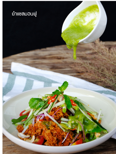
ยำเซลมอนฟู