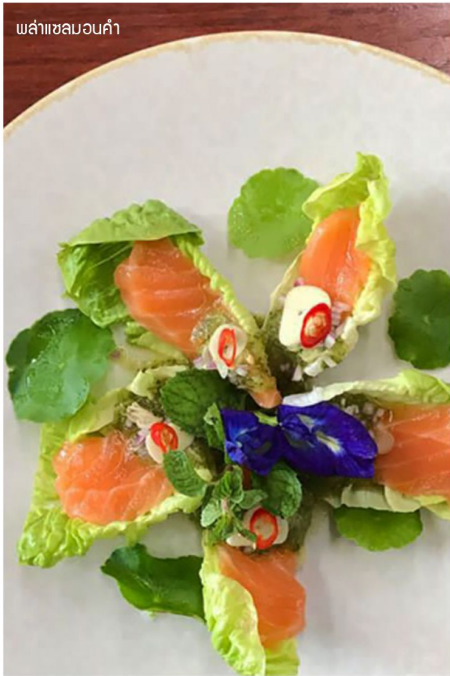
พลาซ่าเซลมอนคำ