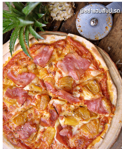
พิซซ่าแฮมสับประสด