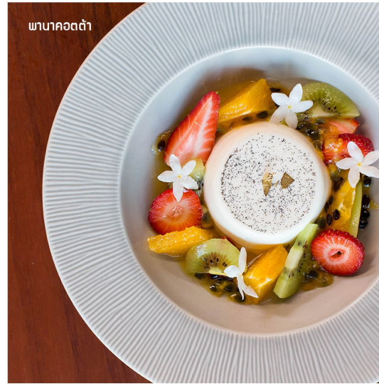
พานาคอตต้า