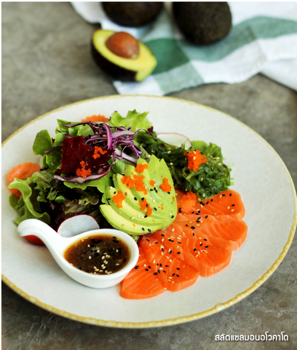
สลัดเซลมอนอโวคาโด