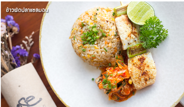
ข้าวผัดปลาเซลมอน