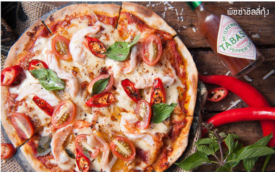
พิซซ่าชีสกุ้ง