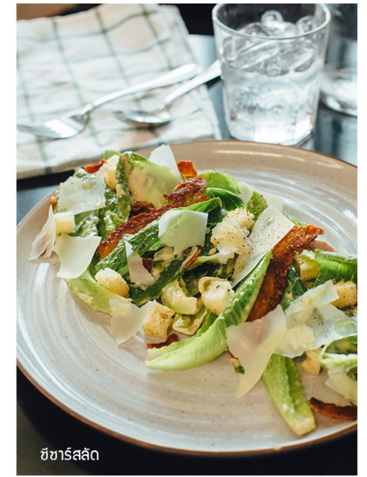
ซีซาร์สลัด