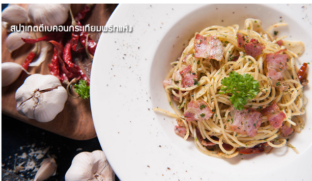
สปาเกตตีเบคอนกระเทียมพริกแห้ง