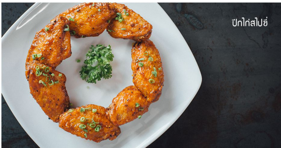
ปีกไก่สไปซี่